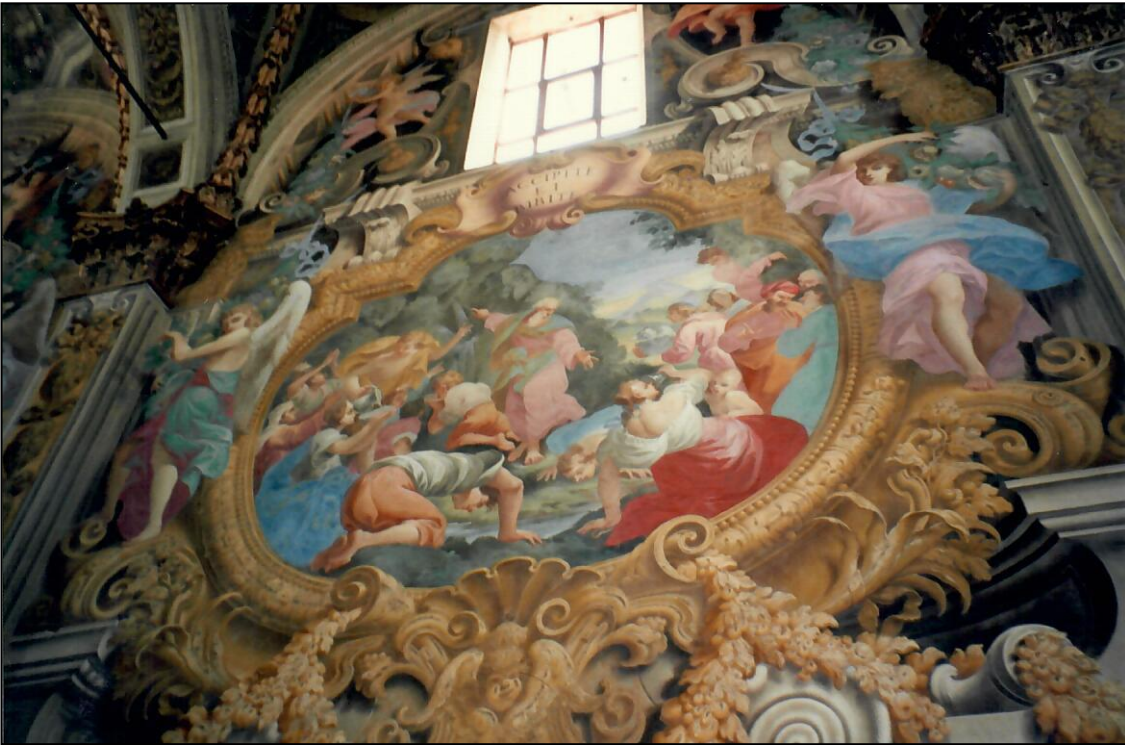
Certosa di Pisa la facciata, un interno e il Chiostro