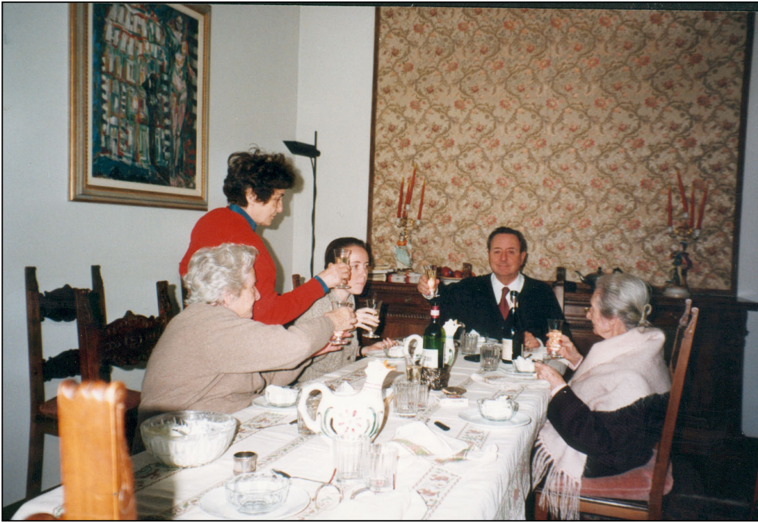
7 Aprile 1996 Pasqua di Resurrezione